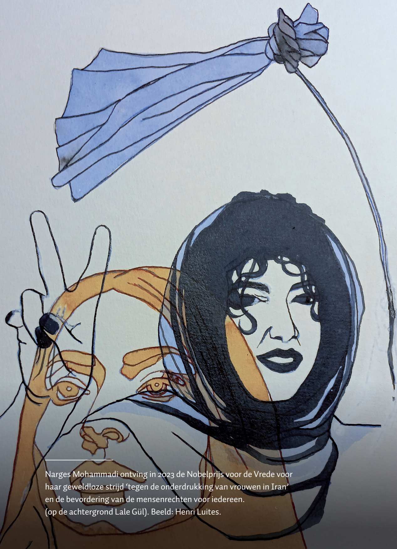
Narges Mohammadi ontving in 2023 de Nobelprijs voor de Vrede voor haar geweldloze strijd 'tegen de onderdrukking van vrouwen in Iran' en de bevordering van de mensenrechten voor iedereen. (op de achtergrond Lale Gül).