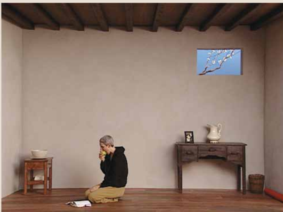
CATHERINE'S ROOM 2001, van Bill Viola, collectie De Pont museum, Tilburg