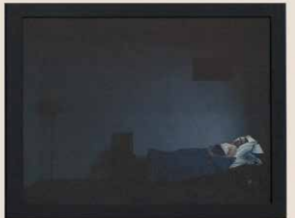
CATHERINE'S ROOM 2001, van Bill Viola, collectie De Pont museum, Tilburg