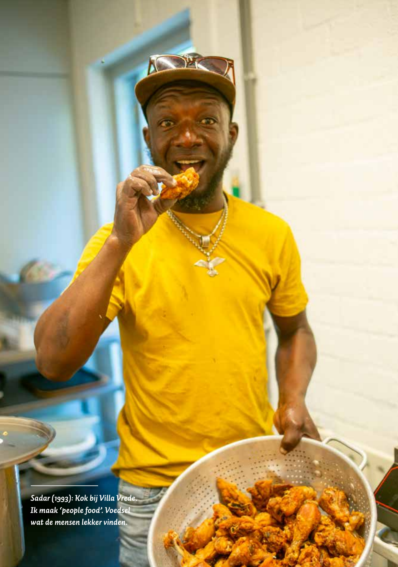
Sadar (1993): Kok bij Villa Vrede. Ik maak 'people food'. Voedsel wat de mensen lekker vinden.