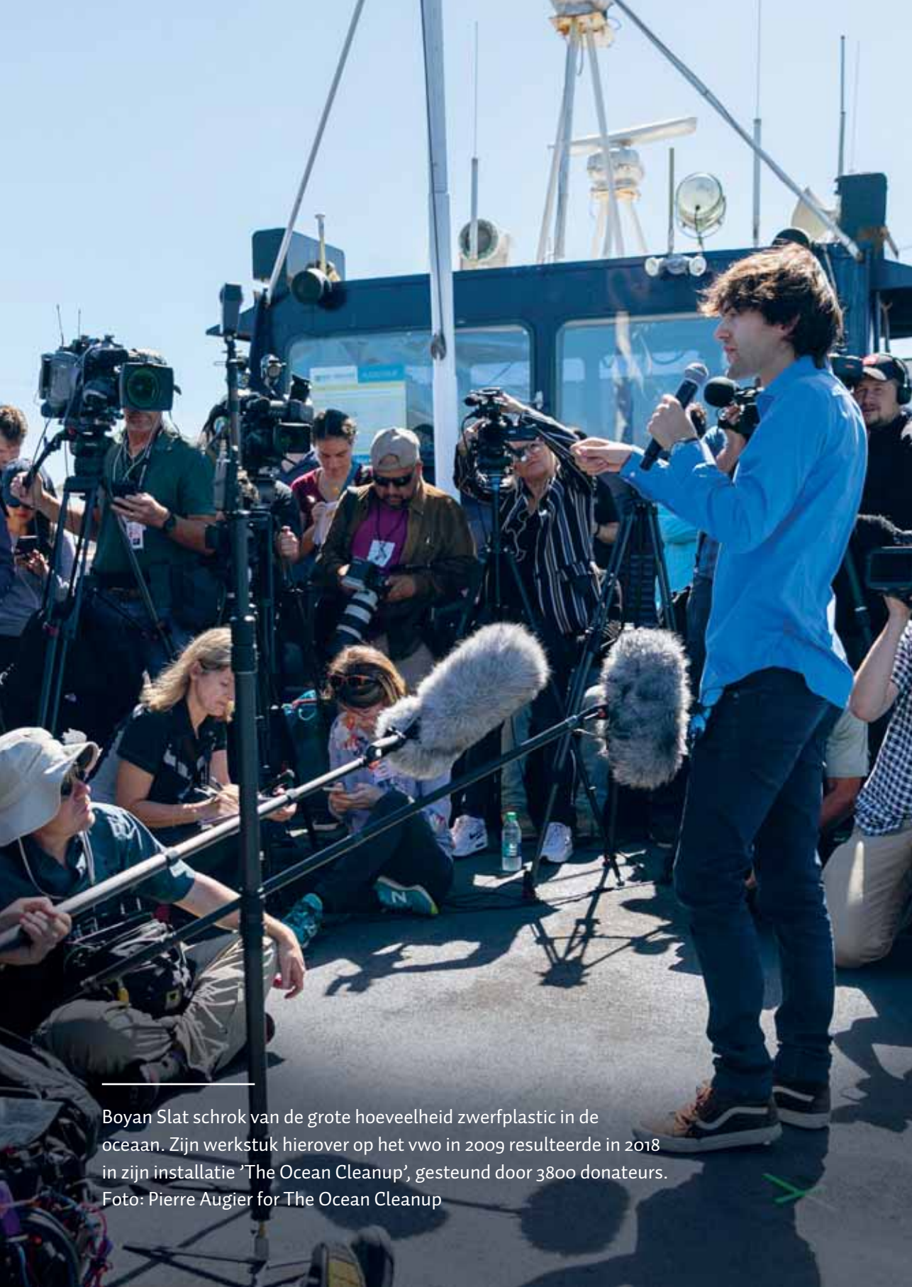
Boyan Slat schrok van de grote hoeveelheid zwerfplastic in de oceaan. Zijn werkstuk hierover op het vwo in 2009 resulteerde in 2018 in zijn installatie 'The Ocean Cleanup', gesteund door 3800 donateurs.