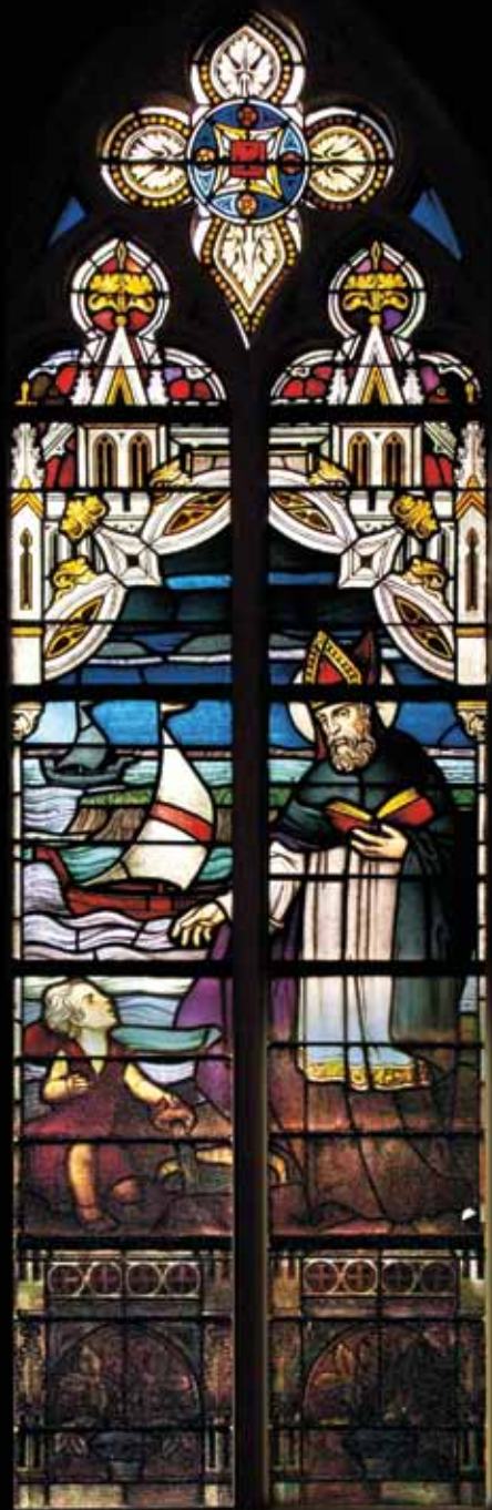
Foto: Edward Aghina, glas-in-loodraam in het Klooster van Geffen. Zie kerkramen.nl , een initiatief van J. Klink en Museum voor Vlakglas- en Emaillekunst Ravenstein