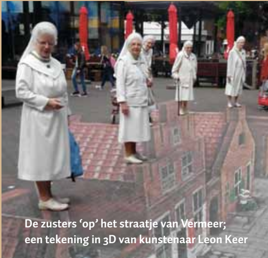
De zusters 'op' het straatje van Vermeer; een tekening in 3D van kunstenaar Leon Keer