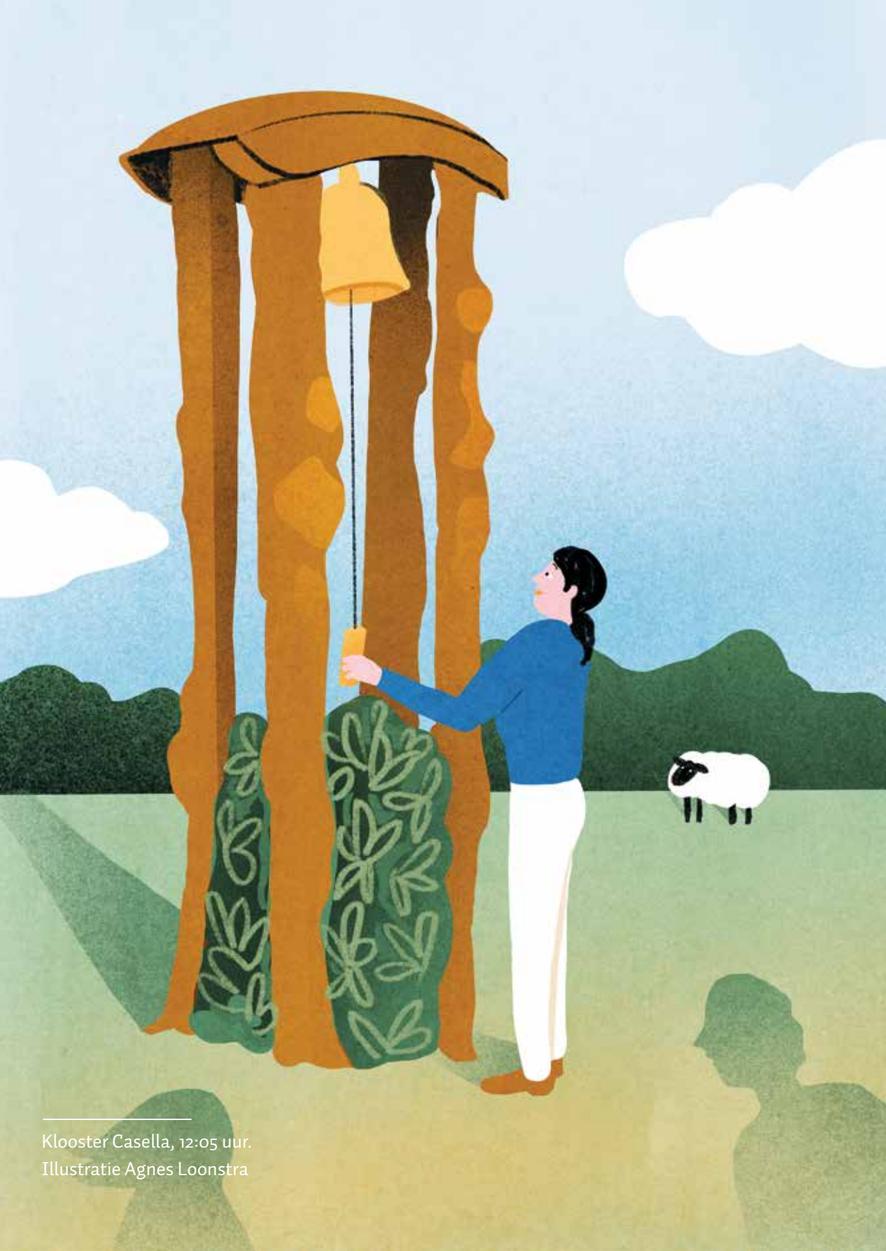
Klooster Casella, 12:05 uur. Illustratie Agnes Loonstra