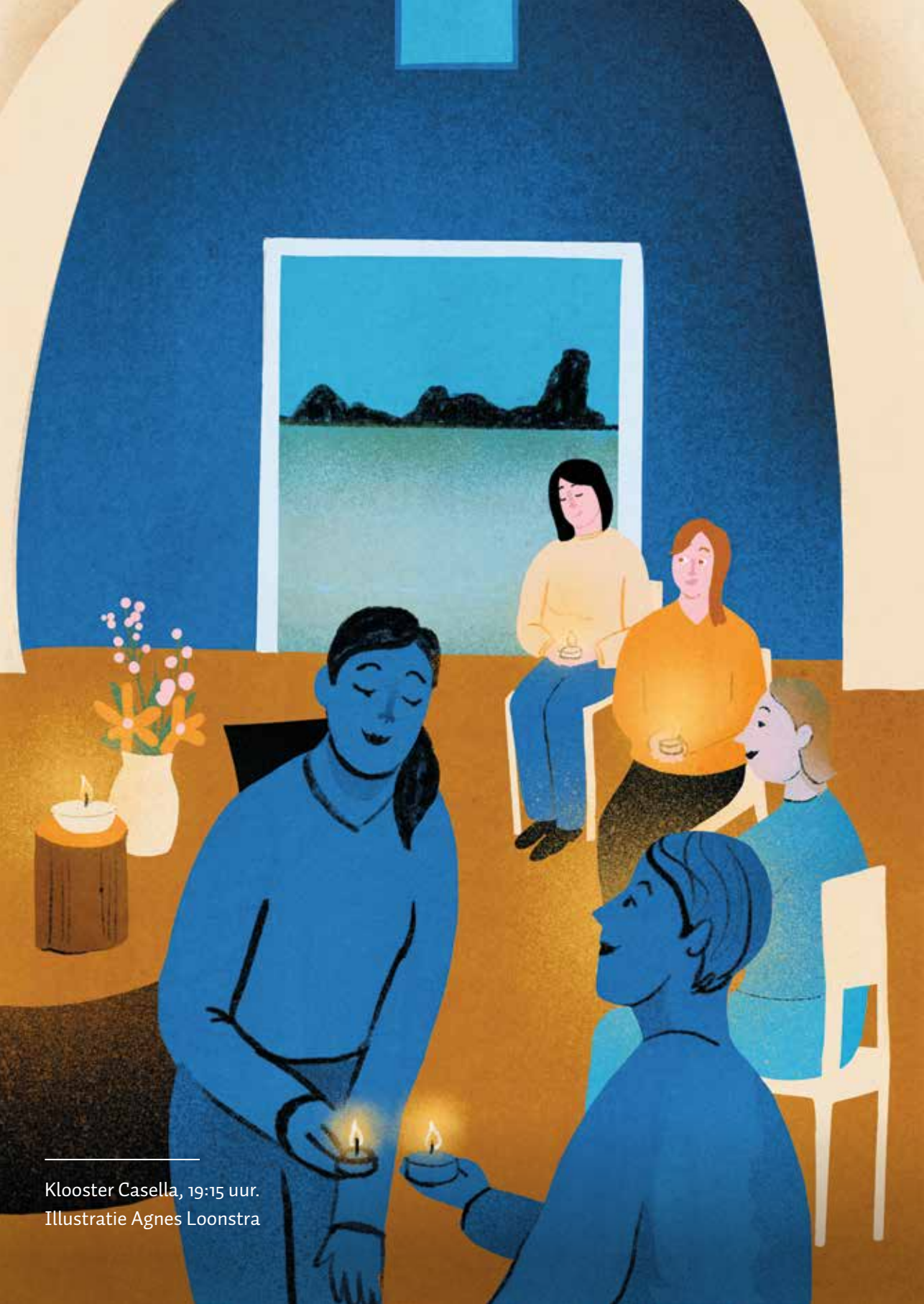
Klooster Casella, 19:15 uur. Illustratie Agnes Loonstra